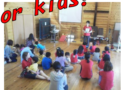
Awanaクラブでの風景 @岬キリスト教会