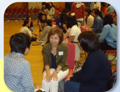
Global Leadership Seminar にて

超教派のTPCを感謝します。神様の祝福により、主の働きの発信源の一つとなって行くことを楽しみにしています。