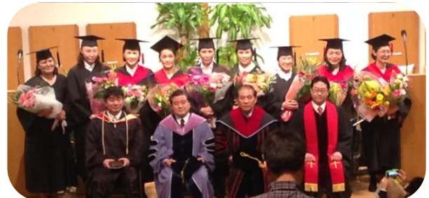
<フルゴスペル神学大学・大学院>