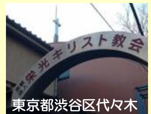
東京都渋谷区代々木

主の御前に礼拝を捧げることは大切です。 それは、神様にお仕えし、隣人に仕える牧会の 中心に位置しているように思うからです。