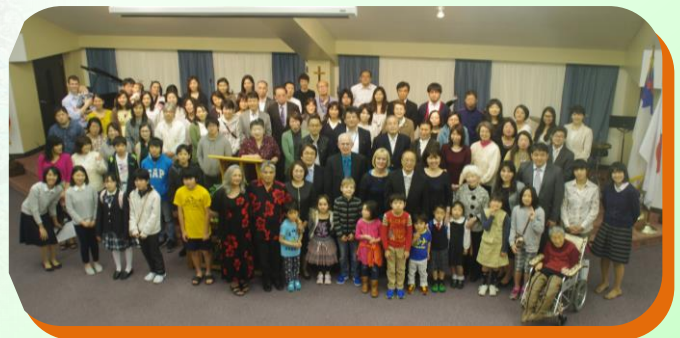
東京メトロチャーチ20周年

ずっと祈り願ってきた新会堂を、主が与えてくださる時が近いことを信じて、福音宣教に邁進して参りたいと思います。どうぞ東京メトロチャーチのためにお祈りください。