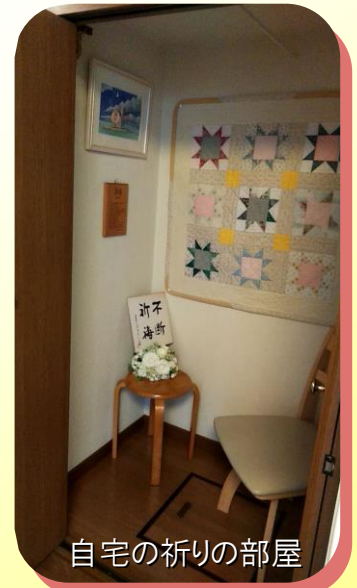
自宅の祈りの部屋

祈れ 世につく 思いは死にて 人をとりなす 身となるまでは 祈れ よし道は 暗くあるとも 祈れ すべてを 主の手に委ねて♪