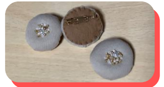
古いTシャツを使ったブローチ

巷には「断捨離こそ正義」であるかのような風潮がありますが、ハンドメイド好きな人間には見るもの全てが素材です。そうそう捨てるなんて出来ません。とは言え、豪邸に住んで自分専用のアトリエがあるわけでもなく、「在庫」がやがて「罪庫」と化しているのが現状。断捨離ブームに乗ってスッキリしたいのはやまやまですが、捨てるなんて考えられません。もともとパッチワークの講師をしていたので、布だけでも凄い量で、関連して、色んなものが散乱してる我が家です。ということで、私なりの断捨離。入ってくるものを極力絶ってあるものを消費することとしました。