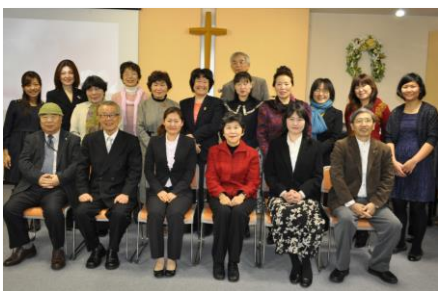
設立時の集合写真

皆様のご希望やご意見をぜひ、お聞かせください。また、このMonthly Reportへの寄稿は随時募集しておりますので、お証しやミニストーリー紹介などがございましたら、事務局までご連絡ください。