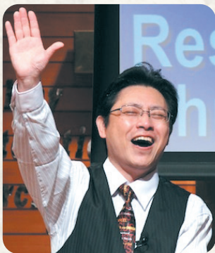
草加神召キリスト教会 主任牧師 日本アッセンブリーズ・オブ・ゴッド教団 理事 総務局長