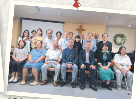
金子 みちひと先生 (グッド・サマリタン・チャーチ牧師、参議院議員) 9月25日 (月)「二倍の祝福」イザヤ書40:1~2