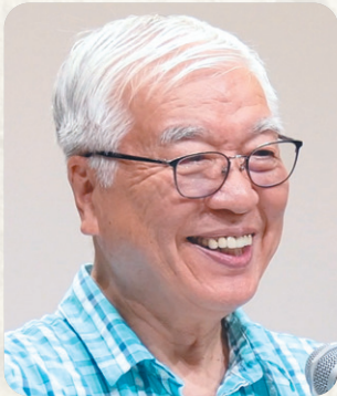
MACF 牧師 東京プレーヤーセンター 顧問